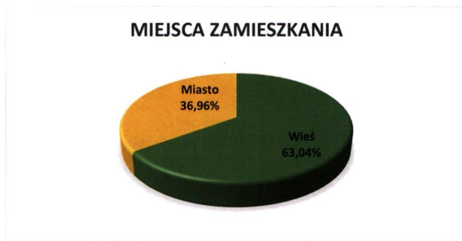
Wykres 4 Udział % osób przeszkolonych wg – miejsca zamieszkania

Osoby zamieszkałe na wsi wykazały większe zainteresowanie udziałem w szkoleniach i stanowiły 63,04 % ogółu.